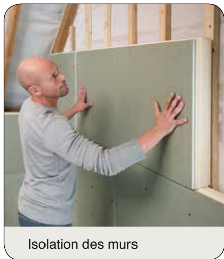
Isolation des murs