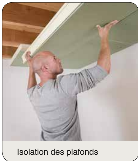
Isolation des plafonds

Les panneaux d'isolation PIR de Recticel Insulation sont largement testés et ils répondent aux normes européennes les plus exigeantes.