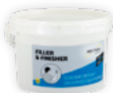
Filler & Finisher