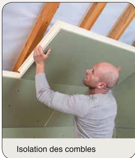
Isolation des combles